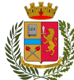
Polizia di Stato