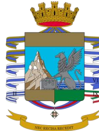
Guardia di Finanza